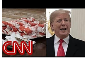
Trump paie des burgers, litres et pizzas servis à la Maison-Blanche