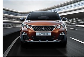
Offres exceptionnelles en ce moment pendant les Venues Proxes Peugeot Offigon