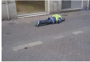
Siège jeune dans le coma - la police des polices valise