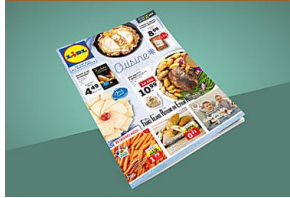
Carrefour Lidl : quelles offres offre semaine ? Lidl