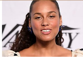
Grammy Awards : plus de diversité, la chanteuse Alicia Keys présente la cérémonie Cubotwin